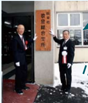
看板の設置（総合支所）