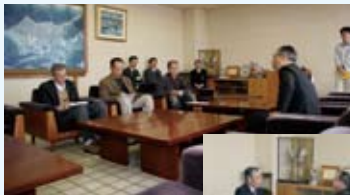
報道機関との面談