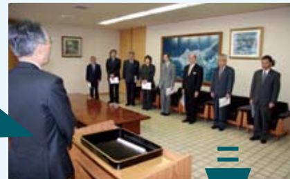
各種行政委員への辞令交付