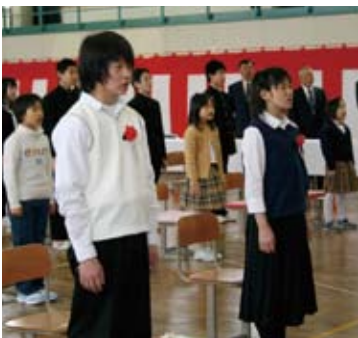
【志美宇丹小中学校 (小学生)】