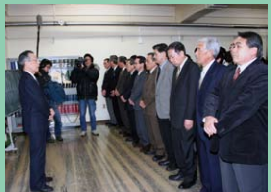
深井歌登町長による閉庁のあいさつ