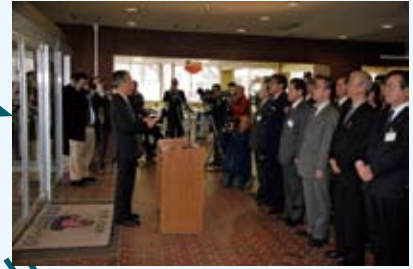
開町（庁）のあいさつ