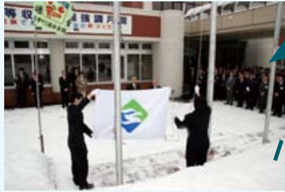
新町旗の掲揚（本庁舎）