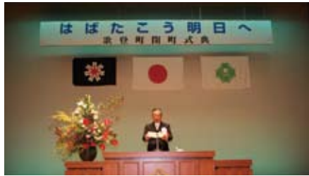
深井町長による式辞