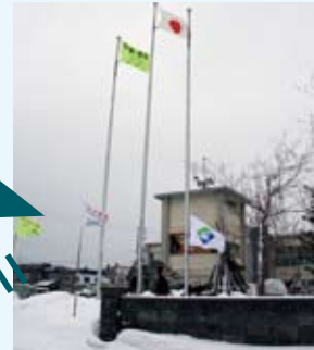
新町旗の掲揚（総合支所）