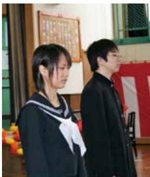
【志美宇丹小中学校 (中学生)】