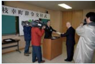
職員辞令交付（課長職）