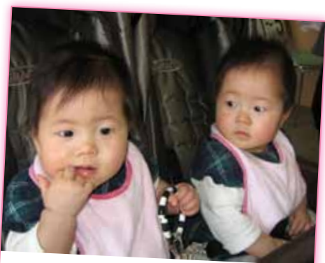
美味しいかも… 何食べたの？