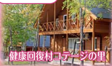
健康回復村コテージの里

◎利用可能期間 10月末日まで 問うたのぼりグリーンパークホテル (☎6 8-3 1 0 1)