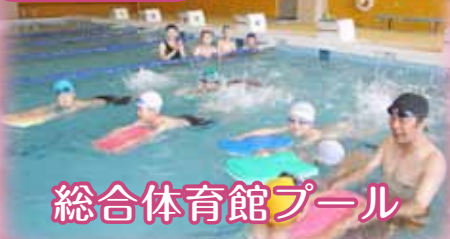
総合体育館プール

◎開館時間 A 10:00▶ P 8:00 ◎利用料 大人(高校生)100円・幼小中生50円 休毎週月曜日 町総合体育館(☎62-1799) (※B & Gプールは7月1日オープン予定)