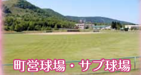
町営球場・サブ球場

◎利用時間 ・枝幸球場 A 5:00▶ P 8:00 ・サブ球場(枝幸) A 5:00▶ P 9:30 町総合体育館 (☎62-1799) ・歌登球場 A 5:00▶ P 8:00 ・サブ球場(歌登) A 5:00▶ P 10:00 町B & G海洋センター (☎68-3417)