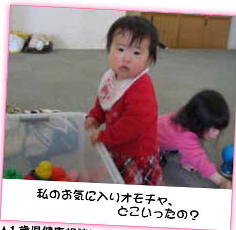
▲1歳児健康相談にて