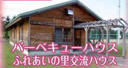
バーベキューハウス ふれあいの里交流ハウス

◎利用時間 A 9:00▶ P 9:00 ■北幸公園・オホーツクグリーンパーク 町建設課土木・施設管理グループ(☎62-1250) ■ふれあいの里交流ハウス 町支所産業建設課産業建設グループ(☎68-2151)