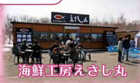
海鮮工房えさし丸

◎5月の営業時間 ▲9:00▶●5:00 (季節により変更あり) 休毎週月曜日 問海鮮工房えさし丸(☎6 2-4 0 5 9)