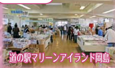
道の駅マリンアイランド岡島

◎開館時間 ▲9:00▶●5:00 (季節により変更あり) 問水産商工課商工・観光グループ (☎6 2-1 2 3 8)