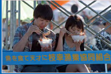
魚を食て天才に枝幸漁業協同組合