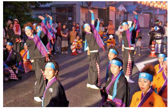
【厳島神社鳥居前での演舞】