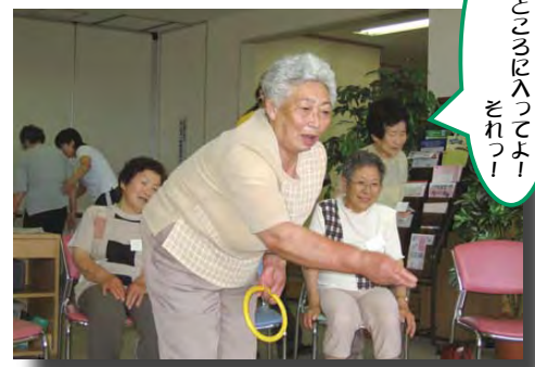
▲2歳児健康相談にて