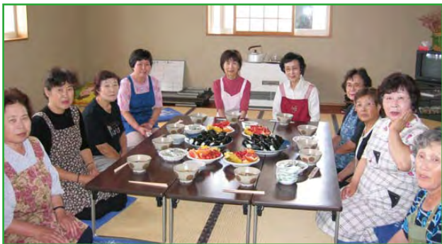
「歌登介護者とともに歩む会」 についてのお問い合わせは、 歌登南町 事務局 歌登保健センター (☎68-3136) まで・・・

介護者とともに歩む会は、介護者の「笑顔」を大切にこれからも活動を続けていきます。