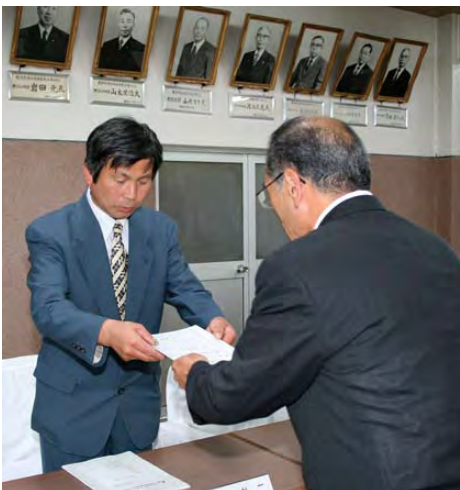
▲ 荒屋町長からの委嘱状交付