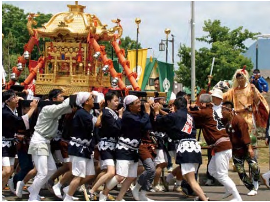
【歌登八幡神社神輿】

10日の歌登八幡神社祭では、最高気温が30度近くになる絶好の天気の下、子ども神輿を含め5基のお神輿が町内を練り歩き、一方、厳島神社祭は、あいにくの天候でしたが、14日の宵宮祭では、今年も神社鳥居内で夢想漣えさしの演舞や夜神輿などが行われるなど、双方とも大変盛り上がりました。