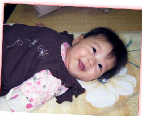
ママ発見!うれしいなあ