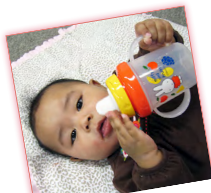
お茶の時間ごーあ