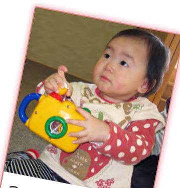
ここを押して撮るんだよ