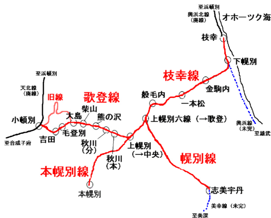
図3. 歌登簡易軌道路線図

歌登町営軌道は殖民軌道として昭和4年に開通した。殖民軌道は、開拓地での交通手段の確保などを目的として、道北・道東を中心とした北海道内に数多く作られていたが、一般的な鉄道・軌道とは異なる簡易的なものだった。当初は小幌別から上幌別六線・枝幸の枝幸線のみだったが、その後も上幌別線、幌別線といった支線が作られていった。また、動力は馬鉄であった。馬鉄とはレールの上を馬がトロッコを引いて走るようなものである。昭和7年7月10日、本線の動力がガソリンカーとなったが、支線は馬鉄のまま昭和40年まで運行を続けた。開拓地の整備や道路網の拡充などが進むにつれてその必要性も失われていき、昭和46年5月29日に廃線となった。