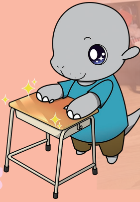
オホーツクミュージアムえさし 公式キャラクター デスモくん