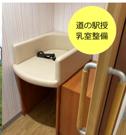
道の駅授乳室整備