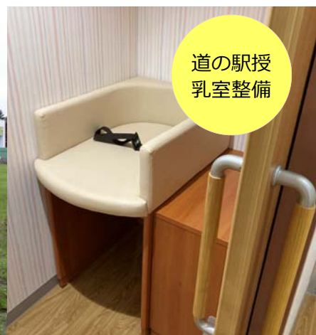
道の駅授乳室整備