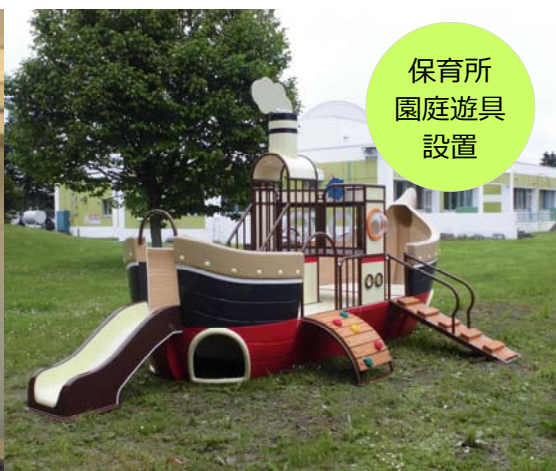
保育所園庭遊具設置